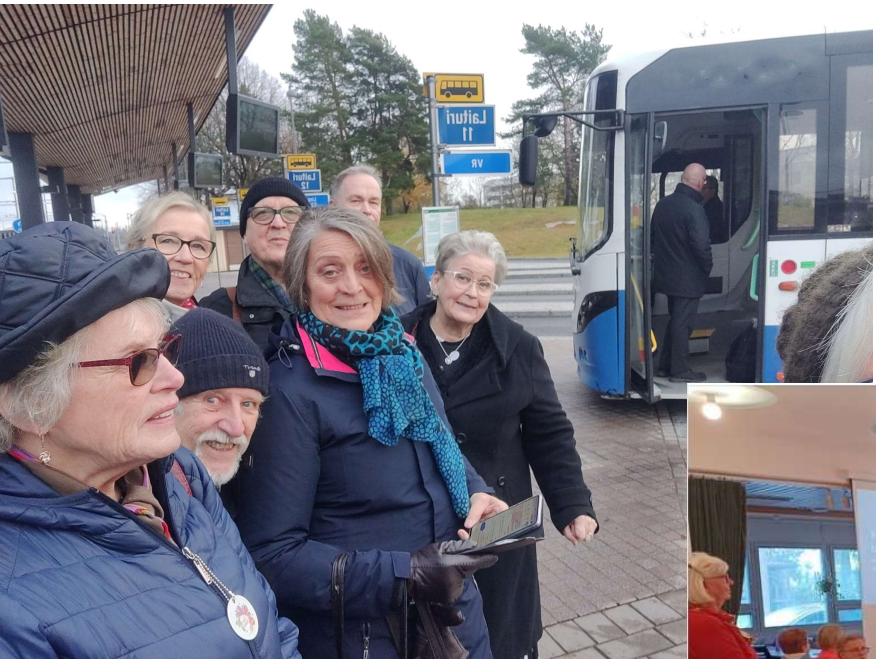
Neuvosto tutustuu Järvenpään paikallis- ja kutsuliikenteeseen, syksy 2023.

on hyvin. Sekä ikäihäisten kehittäminen on tärkeää, että ympärivuorokautisessa hoitotilanteissa olevien määrän on pienentynyt, mutta vanhuksen terveys- ja toimintakyky eivät ole parantuneet.