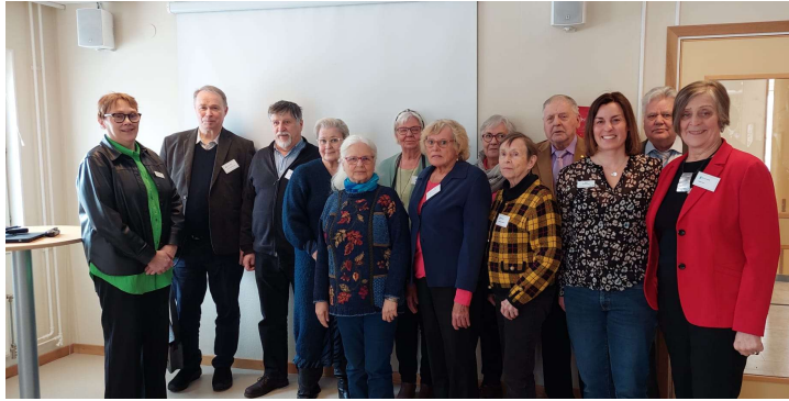
Inspiroiva vierailu ystävyyskaupunki Täbyyn, maaliskuu 2023.

Yleisötilaisuus keskiviikkona 15.3. klo 16.30-18