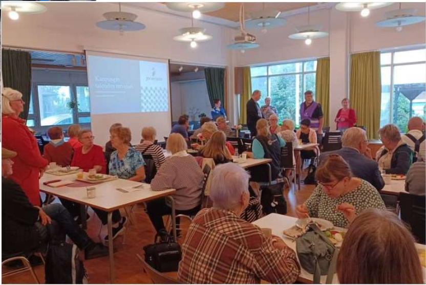
Aamiaistreffeistä tuli heti suosittu, syksy 2023.