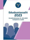
Eduskuntavaaliehdokkaat tentissämme maaliskuussa.

Paikka: Myllytien toimintakeskus Myllytie 11, 04400 Järvenpää