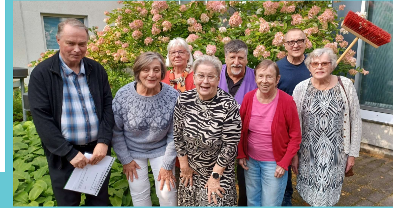
Tuore eläkeläisneuvosto 1.6.2023-31.5.2025.

Pidä tauko kauppareissullasi ja poikkea kahvilla